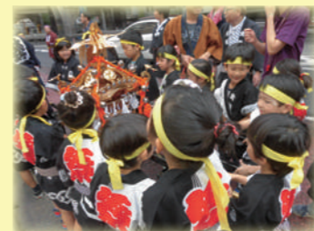
(左上) 世田谷の特産品、大蔵大根 (右上) 八幡神社の例大祭でおみこし担ぎ